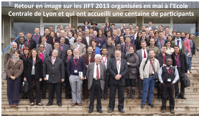
Retour en image sur les JIFT 2013 organisées en mai à l'École Centrale de Lyon et qui ont accueilli une centaine de participants

Quelques mots sur la conférence Nano- and Micromechanical Testing in Materials Research and Development IV qui s'est déroulée du 6 au 11 octobre 2013 à Olhão au Portugal :